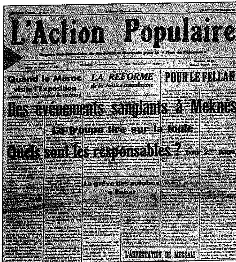
Journal l'Action Populaire , septembre 1937

La une de l'Action Populaire , septembre, 1937